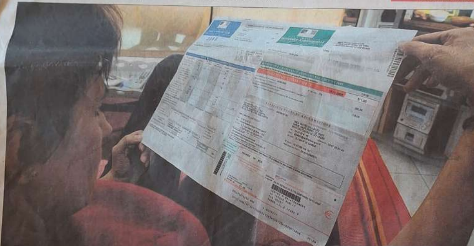
La Région doit trouver un million d'euros pour équilibrer son budget. Les contribuables sont donc appelés à la rescousse.