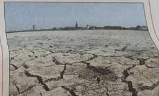
Des hivers rigoureux à cause... du réchauffement.

L'Europe doit se préparer à un coup de chaud et froid