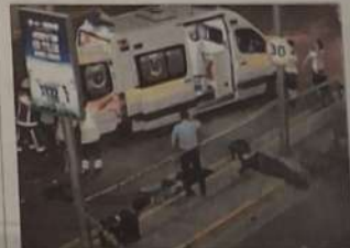
■ L'aéroport Atatürk a été visé hier soir: il y a au moins 28 morts et 60 blessés.