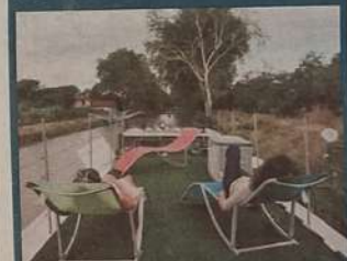
■ Des chambres d'hôtes sur le bateau. V. L.

Dormir dans une péniche sur le canal du Midi