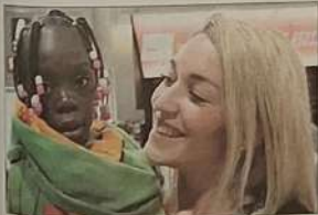
La petite fille a eu l'œsophage détruit par l'acide.