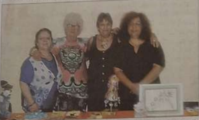
Une vente d'objets de toute sorte s'est déroulée au foyer municipal.

L'association Les talents cachés organisait une vente d'objets, au foyer municipal. Manifestation qui n'a pas reçu le succès escompté. Malgré tout, ces mamies ont la pêche. En effet, durant toute l'année, elles ont mis en place des ateliers créatifs, les mardis et vendredis après-midi. Elles ont confectionné de nombreuses créations (échar-