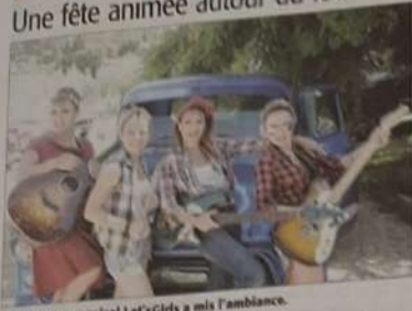
Le groupe musical Let's Girls a mis l'ambiance.

C'est avec beaucoup de succès que la fête autour du four s'est déroulée. À l'ouverture, dès 10 heures, les boulangers étaient déjà au travail, depuis bien longtemps dans le four du village. La première fournée de 100 pains est sortie avant 11 heures. Il y a eu deux autres fournées et tous les pains sont partis très rapidement. Pour l'apéritif, les boulangers ont aussi fait des pizzas qui ont été distribuées parmi la foule. En même temps, se mottait en place, le groupe de musique Let's Girls, qui a animé la fête, toute la journée pour le bonheur de tous, certains ont même dansé. Ce groupe de quatre belles jeunes filles ont vraiment fait l'unanimité. Avant le déjeuner, les voitures de collection étaient aussi en place, toutes brillantes et rotatives, pour le bonheur des amateurs et des connaisseurs. Ensuite, les participants ont pu se mettre à table pour partager leur pique-nique, ceux ayant oublié leur panier ont pu se fournir en sandwichs variés, à la buvette. Étaient aussi distribués des boissons, du vin et de la bière, ce qui a rajouté beaucoup d'ambiance à l'ensemble. Dans l'après-midi, les gens ont pu profiter des nombreux jeux, en bois géants qui ont fait la joie des jeunes et des moins jeunes. Cette fête placée sous le signe de la bonne humeur et de la convivialité était organisée comme tous les ans, par l'association des Amis de Saint-Jean.