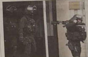
■ Les policiers de la DGS ont interpellé, hier, un couple de Carcassonnais et un Perpignanaise.