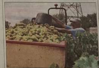
■ Dix jours d'avance pour la récolte. S. C.