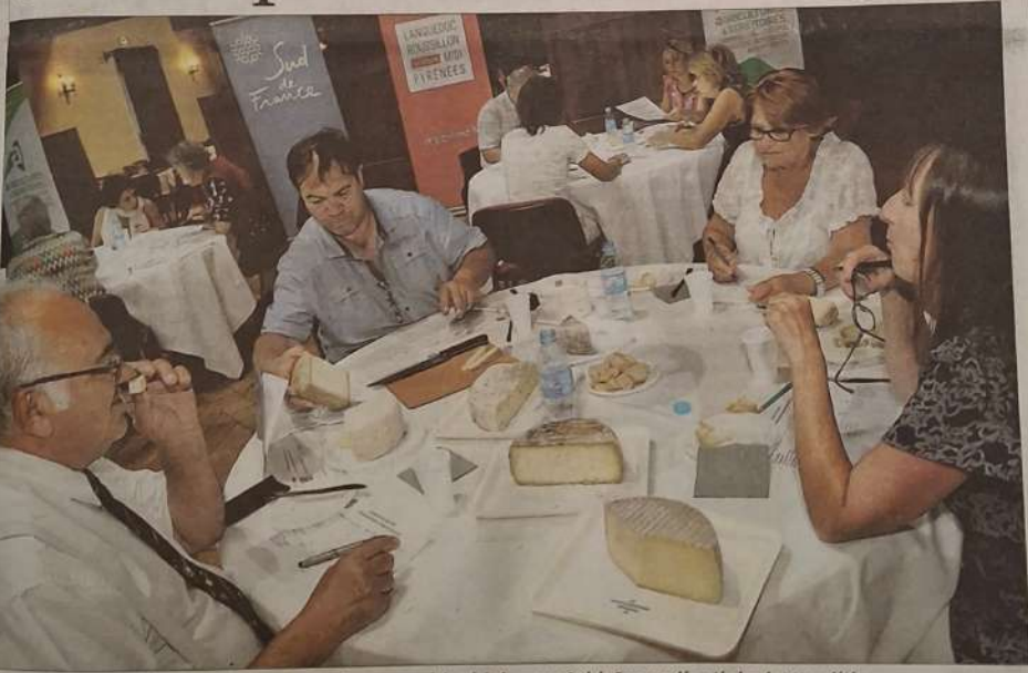
■ Au Mas de Saporta, à Lattes, le jury de la 9 e édition du concours régional de fromages Sud de France a dégusté plus de 200 variétés.