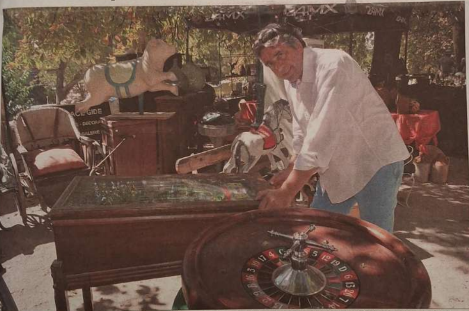
■ De nombreuses surprises attendent les chineurs, à l'image de cette roulette foraine et de ce billard mécanique, jusqu'à ce mardi soir. J.-F.G.