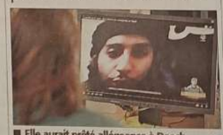
■ Elle aurait prêté allégeance à Daech. M.E. ■ RÉGION