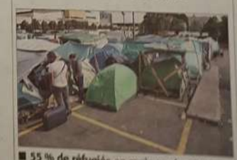
■ 55 % de réfugiés en moins qu'en 2016. M.E. ■ MONDE