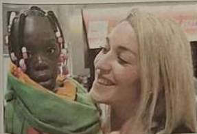
La petite fille a eu l'œsophage détruit par l'acide.