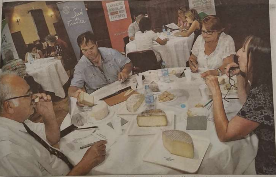
■ Au Mas de Saporta, à Lattes, le jury de la 9 e édition du concours régional de fromages Sud de France a dégusté plus de 200 variétés.